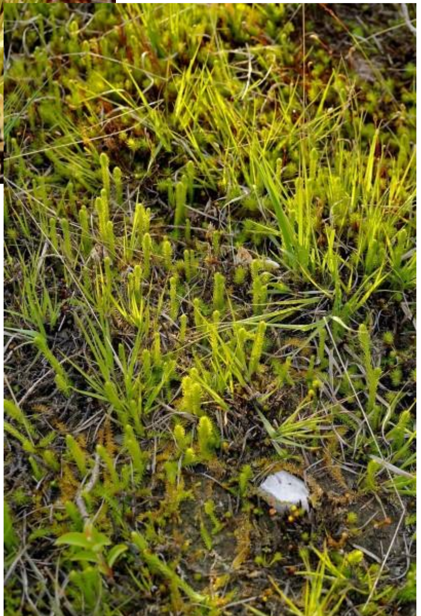
Evenals de moeraswolfsklauw maar dan in het iets vochtiger deel