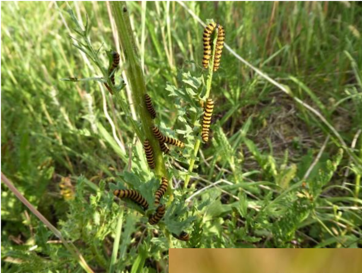
De rupsen van de Sint Jacobsvlinder waren nog aan hun avondeten bezig