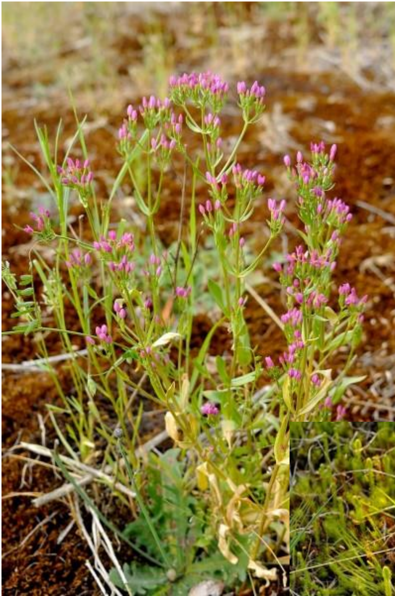
Het duizendguldenkruid is er massaal aanwezig