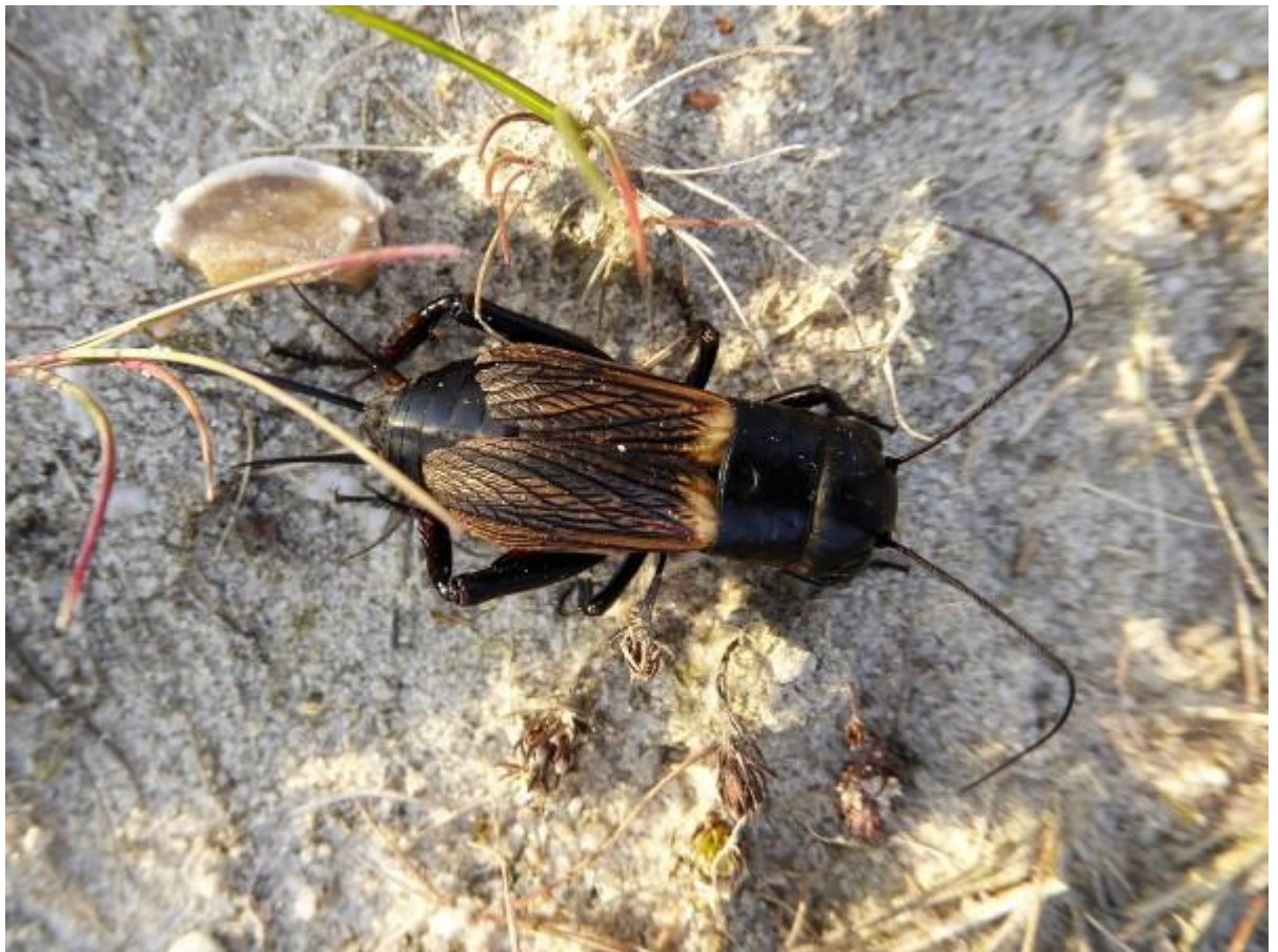
Hier alvast de krekkel, de mier hebben we niet gevonden