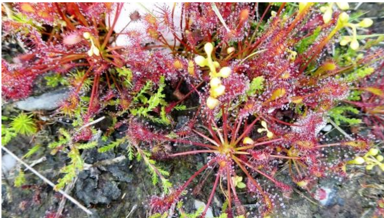
Tussen de wolfsklauw ook bloeiende zonnedaauw